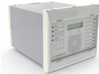
Pohled na MiCOM ALSTOM P241