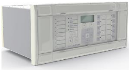
Pohled na MiCOM ALSTOM P243

Ochrany MiCOM Alstom P24x nabízejí komplexní balíček ochranných funkcí pro chránění synchronních i asynchronních motorů.